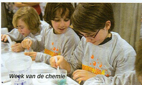
Week van de chemie