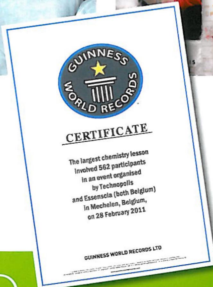
of essenscia during the International Year of Chemistry