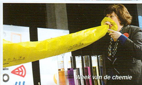
Week van de chemie