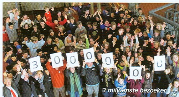
3 miljoenste bezoeker