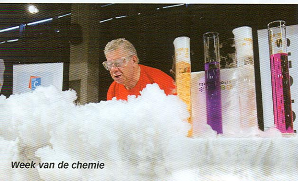
Week van de chemie